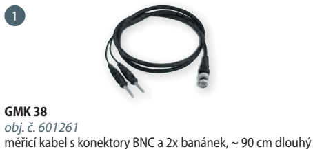
GMK 38 obj. č. 601261 měřicí kabel s konektory BNC a 2x banánek, ~ 90 cm dlouhý