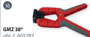
GMZ 38* obj. č. 605783 měřicí kleště pro měření dých a slabých výrobků ze dřeva (do tloušťky ~ 10 mm)