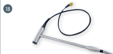
GSF 50TF (110 cm) obj. č. 601312 GSF 50TFK (43 cm) obj. č. 601313 zapichovací snímač s teplotním senzorem, pro měření do hloubky 40 cm popř. 107 cm, včetně 1 m přípojovacího kabelu, určen pro štěpku, dřevitou vlnu, třísky, seno, slámu, obilí, piliny atd.