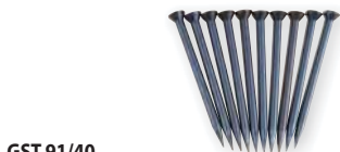
GST 91/40 obj. č. 601275 ocelové hřeby 10 ocelových hřebů v plast. dóze, Ø 2,5 mm, délka 40 mm