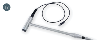
GSF 50 (110 cm) obj. č. 601306 GSF 50K (43 cm) obj. č. 601308 zapichovací snímač (bez teplotního senzoru), pro měření do hloubky 40 cm popř. 107 cm, včetně 1 m přípojovacího kabelu, určen pro štěpku, dřevitou vlnu, třísky, seno, slámu, obilí, piliny atd.