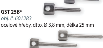
GST 25B* obj. č. 601283 ocelové hřeby, dtto, Ø 3,8 mm, délka 25 mm