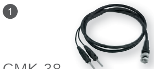
GMK 38 obj. č. 601261