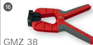
GMZ 38 obj. č. 605783