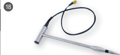
GSF 50TF (110cm) obj. č. 601312

(bez teplotního senzoru) pro měření do hloubky 40 cm popř. 107 cm, včetně 1 m připojovacího kabelu, určen pro štepku, dřevitou vlnu, třísky, seno, slámu, obilí, piliny atd.