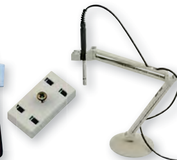
GEH 1 se snímačem

obj. č. 601091 magnetický držák pro přístroje s integrovanou opěrkou