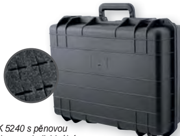
GKK 5240 s pěnovou vložkou pro individuální přizpůsobení