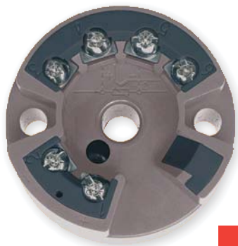
PŘEVODNÍK PRO PT100 / TERMOČLÁNKY / ODPOROVÉ A NAPĚTOVÉ VYSÍLAČE